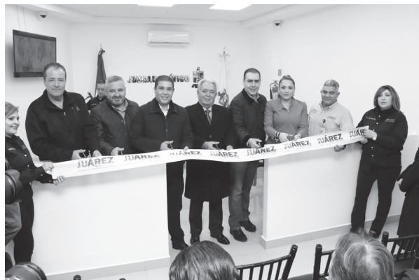
El tradicional corte de listón.