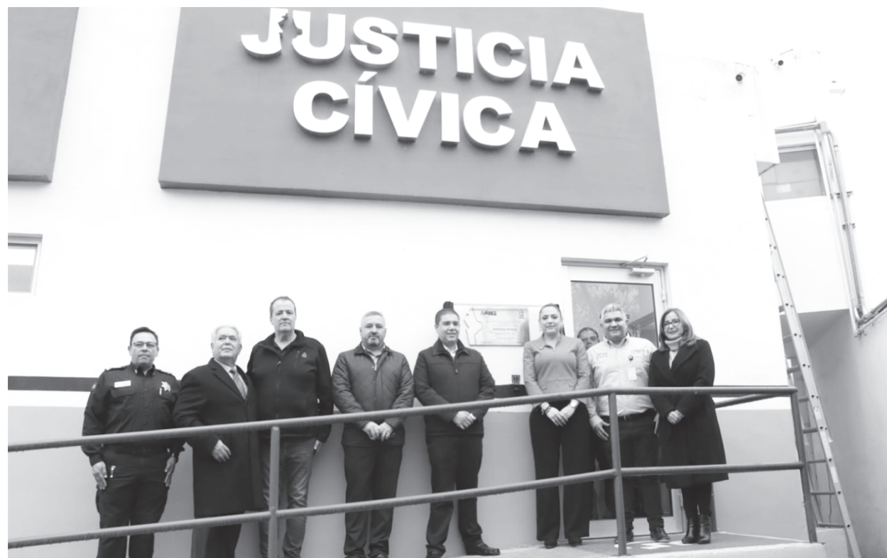
Inauguración del Centro de Justicia Cívica.

más de recibir el apoyo por parte de un equipo multidisciplinario entre los que hay psicólogos, médicos y abogados de oficio.